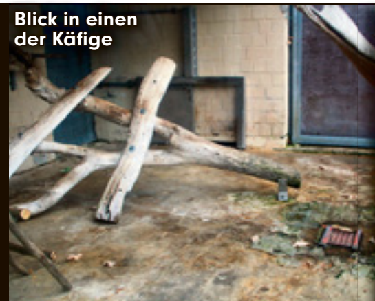
Blick in einen der Käfige