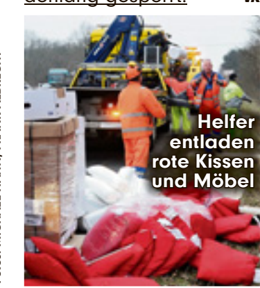
Helfer entladen rote Kissen und Möbel

Rohrbach - Unbeabsichtigte IKEA-Schau mitten auf der Autobahn . Gegen 5.50 Uhr kam ein DHL-Laster auf der A 6 von der Bahn ab, brettete in den Straßengraben , pflügte durchs Gebüsch und knallte schließlich gegen einen Baumstamm . Die Zugmaschine des 24-Tonnners wurde beim Aufprall bis auf die Fahrerseite fast komplett zerdrückt . Der Fahrer (50) wurde nur leicht verletzt . Auf der Rückseite der Ladung durch die aufgerissene Plane : Möbel und Wohnaccessoires für den IKEA-Markt in Lisdorf . Um das Gespann zu bergen , mussten u. a. Blomster-Vasen , Pax-Kleiderschränke , Klobbürsten und Nackenrollen entladen werden. Am Nachmittag konnte der Transporter mit einem Spezialkran aus dem Graben gezogen werden. Eine erste Schätzung geht von weit über 100.000 Euro Schaden aus. Auf der A 6 war die rechte Spur stundenlang gesperrt. tk